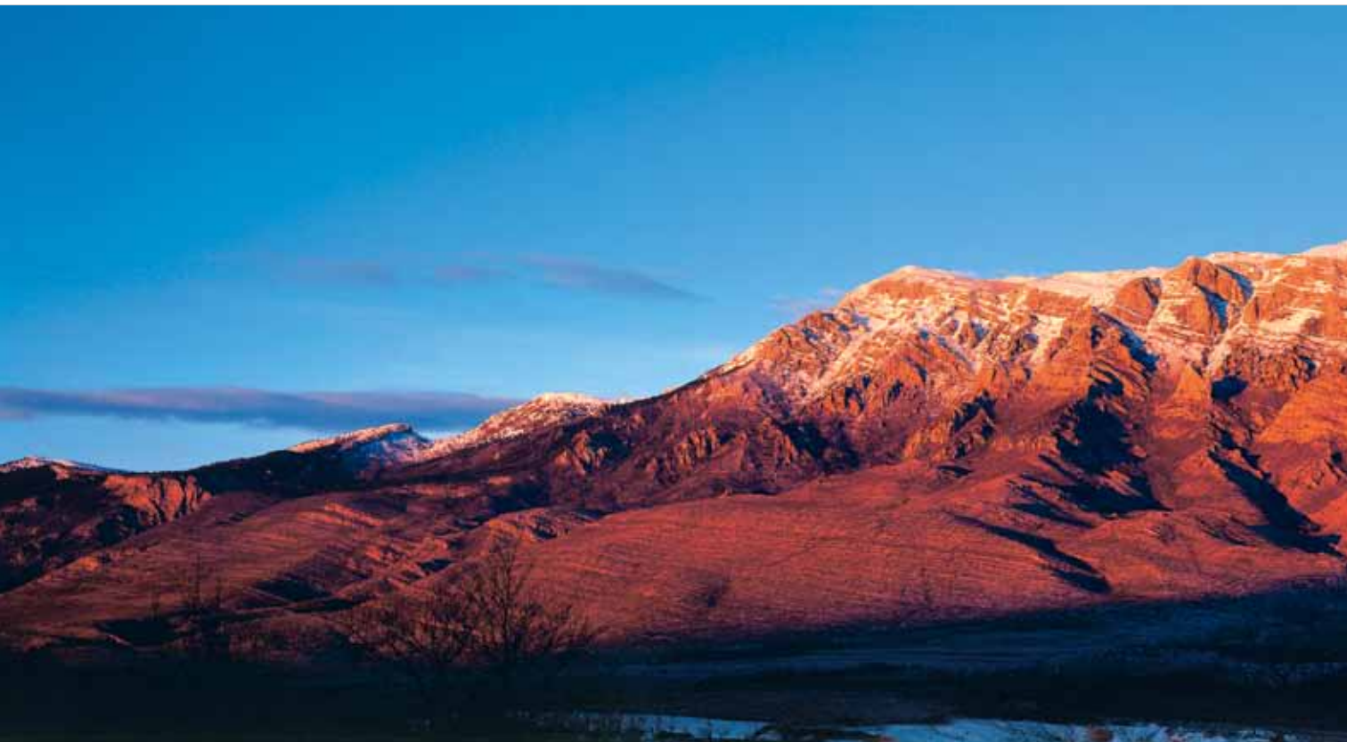
Dinara v večerni svetlobi

v planinsko ovčerejo kot prebivalci Livanjskega polja in so zato izkoriščali večji del Dinare. Obledele kronike pričajo, da so imeli Dalmatinci pred drugo svetovno vojno na Troglavu in Dinari 500 pastirskih stanov in 135000 ovac, Bosanci pa 20 stanov in 15000 ovac. Pašna pravica je bila tudi predmet dolgotrajnih sporov, ki so se končali šele leta 1730, ko je bila na osnovi terenskega pregleda, ki ga je opravila 23. turško-beneška komisija leta 1721, določena dokončna meja in vzpostavljena t. i. Mocenigova linija. Večji in višji del Dinare je pripadel Dalmaciji, manjši in nižji pa Bosni. Ta linija se od takrat ni spreminjala in je danes meja med Hrvaško in Bosno. Posledično so se najvišji vrhovi Troglava in Kamešnice znašli na bosanski strani. Na površino risanih zemljevidih je vrh Troglav (1913 m) narisana kot mejna kota in so ga zato dolgo imeli za najvišji vrh Hrvaške, čeprav sega kar dober kilometer v notranjost Bosne, prav tako tudi vrh Kamešnice Konj (1861 m). Najvišja točka na hrvaškem ozemlju je tako vrh Dinare – 1831 metrov nad morjem.