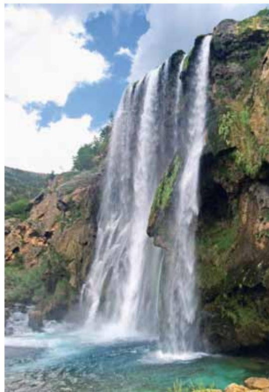
Topoljski buk, slap Krčića

Čeprav je pot do sprejetja Dinare kot nacionalnega simbola še dolga, je je kar nekaj že tudi prehojene. Hrvaški planinci so takoj po osvoboditvi Dinare začeli s