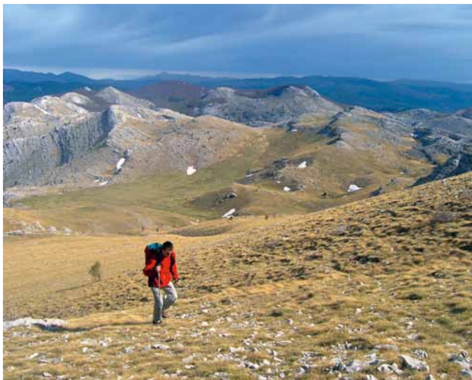
Na poti od Brezovca do vrha Dinare

Ko se sonce pokaže na Uknovcu, grebenu zahodno od Samograda, je ura sedem zjutraj, osem pa, ko obsije vrh Samograda. Ko je obsijana cela vzhodna stran Samograda, je ura devet, deset pa, ko je obsijane pol njegove južne strani, druga polovica pa je še v senci. Točno opoldan na Samogradu in bližnjih policah ni več senc.