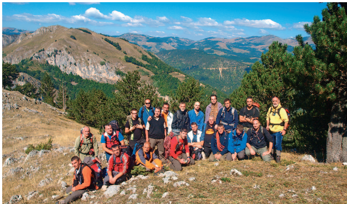
Kosovski i hrvatski vodiči na tečaju za planinarske vodiče Planinarskog saveza Kosova u Prokletijama