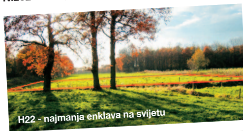
H22 - najmanja enklava na svijetu

■ Belgija i Nizozemska dijele grad Baarle i teritorije u njegovoj okolini na vrlo kompliciran način. Nizozemski dijelovi grada pripadaju općini Baarle-Nassau, a belgijski općini Baarle-Hertog, pri čemu je cijeli grad rascjepkan na ukupno 22 enklave. Nizozemski dio sastoji se od osam enklava, od kojih je šest okruženo teritorijem središnje Baarle-Hertog enklave. Sedma enklava okružena je Oordeel enklavom, a samo se osma nalazi unutar matičnog teritorija Belgije. Posvuda po gradu is crtane su granične crte, a one na mnogim mjestima prolaze i kroz kuće, kafiće i trgovine. Osim u gradu, u okolini je još 25 većih i manjih enklava. Najmanja enklava na svijetu je obična oranica površine 2632 četvorna metra (enklava H22) koja pripada Nizozemskoj.