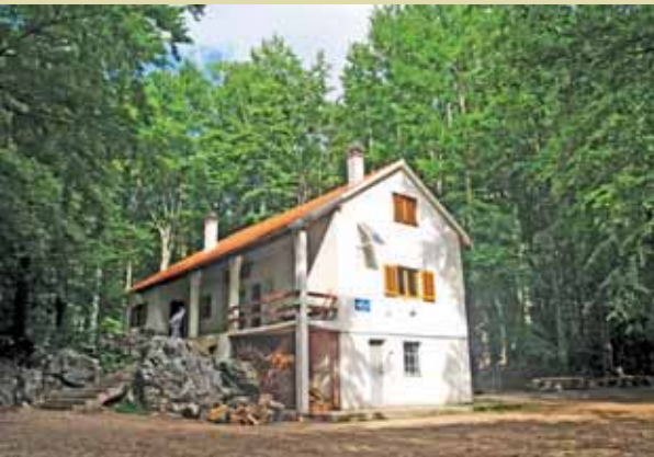
Planinarska kuća Brezovac

nje visoko u njedra planine polazi iz naselja Guge, koje je predgrađe Knina. Cesta je zavojita i prašnjava, a na nekim mjestima strma, pa onome tko se uputi autom prema Dinari treba dosta vozačkog umijeća. Kad se u višem dijelu cesta suzi, uistinu imate dojam da ste došli u kraj dalek od stvarnog svijeta.