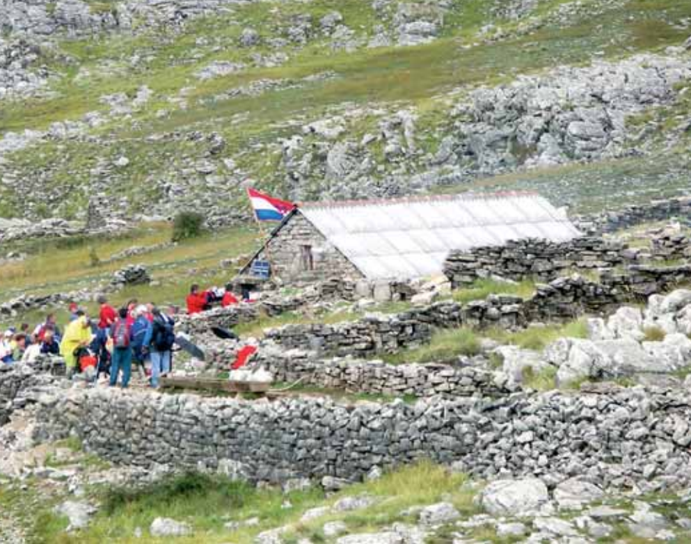
Planinarsko sklonište Martinova košara