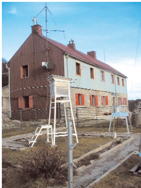
Planinarski dom »Zavižan«

Kakvoću rada meteorološke postaje ne određuju toliko instrumenti kojima je opremljena, koliko marljivost, savjesnost i stručnost vremenskih motritelja. Nepravovremenost, netočnost ili nereditovitost motrenja može poništiti korist od posjedovanja najsuvremenijih, profinjjenih i točnih meteoroloških sprava. Sklonost prema propustima u obavljanju vremenskih motrenja obično je srazmjerna teškoćama prisutnim pri mjerenjima i opažanjima. Takve se nepovoljne okolnosti najčešće zamjećuju na visinskim meteorološkim postajama, u visokim gorama i planinama. One su uvelike posljedica klimatskih obilježja takvih područja, jer su u njima nepovoljna vremenska stanja češća i izraženija nego u nizinama. Jaka studen, olujni vjetrovi, obilni snjegovi, opasni gromovi i magleni zastori zacijelo nisu primamljivi izazovi za izlazak iz sigurnog i udobnog skloništa radi vremenskog motrenja. Dakako, usamljenost, odvojenost od obitelji i društva, nedostatak udobnosti i zabave - što je sve prisutno na takvim izdvojenim postajama - mogu samo otežavati