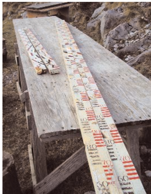
Najviša izmjerena visina snijega je 320 cm!

- Neki nam ne vjeruju kad kažemo da zimi često za odlazak na motrenje do meteorološke kućice ili do snjegomjera trebamo stavljati krpље ili dereze, dopunjuje ga sin Ante.