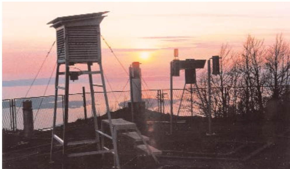
Suton na Zavižanu