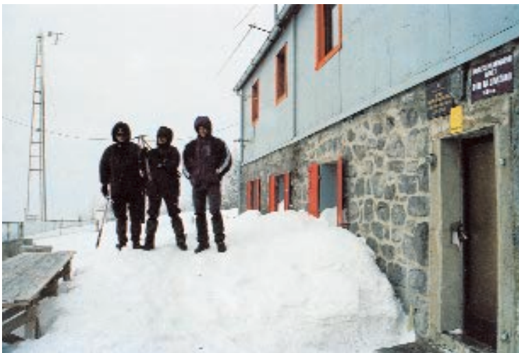
Snijeg pred planinarskim domom