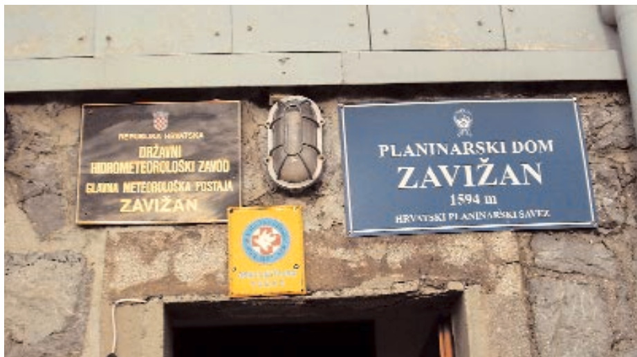
Natpisne ploče na domu: meteorološka stanica, obavještajna točka GSS i planinarski dom