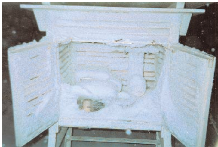
Meteorološka kućica ujutro

»Imala sam sreću da je onda kad sam radila najviši snijeg bio samo metar i pol«, priopćila nam