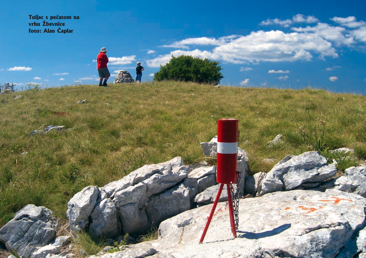
Tuljac s pečatom na vrhu Žbevnice

Zbog takvih nejasnoća, nameće se potreba da se stare definicije pojmova planinarska obilaznica i kontrolna točka i prateće podjele zamijene novima. Podjela koju ćemo u daljnjem tekstu predložiti već se koristila i potkrijepljena je mnogim primjerima u priručniku natjecanja »Gojzerica«, koji je izdalo HPD »Željezničar« iz Zagreba.