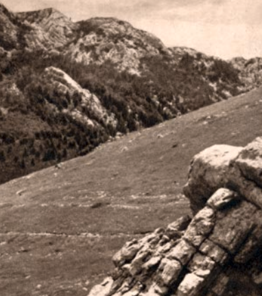
Veliki Zavžan