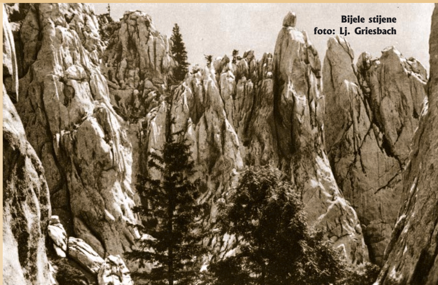
Bijele stijene