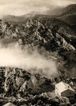
Risnjak sa Šlošerovim domom