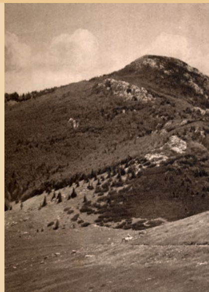
Vražji prolaz