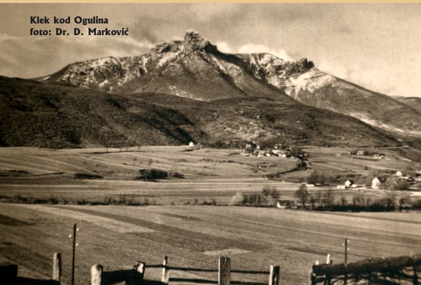
Klek kod Ogulina