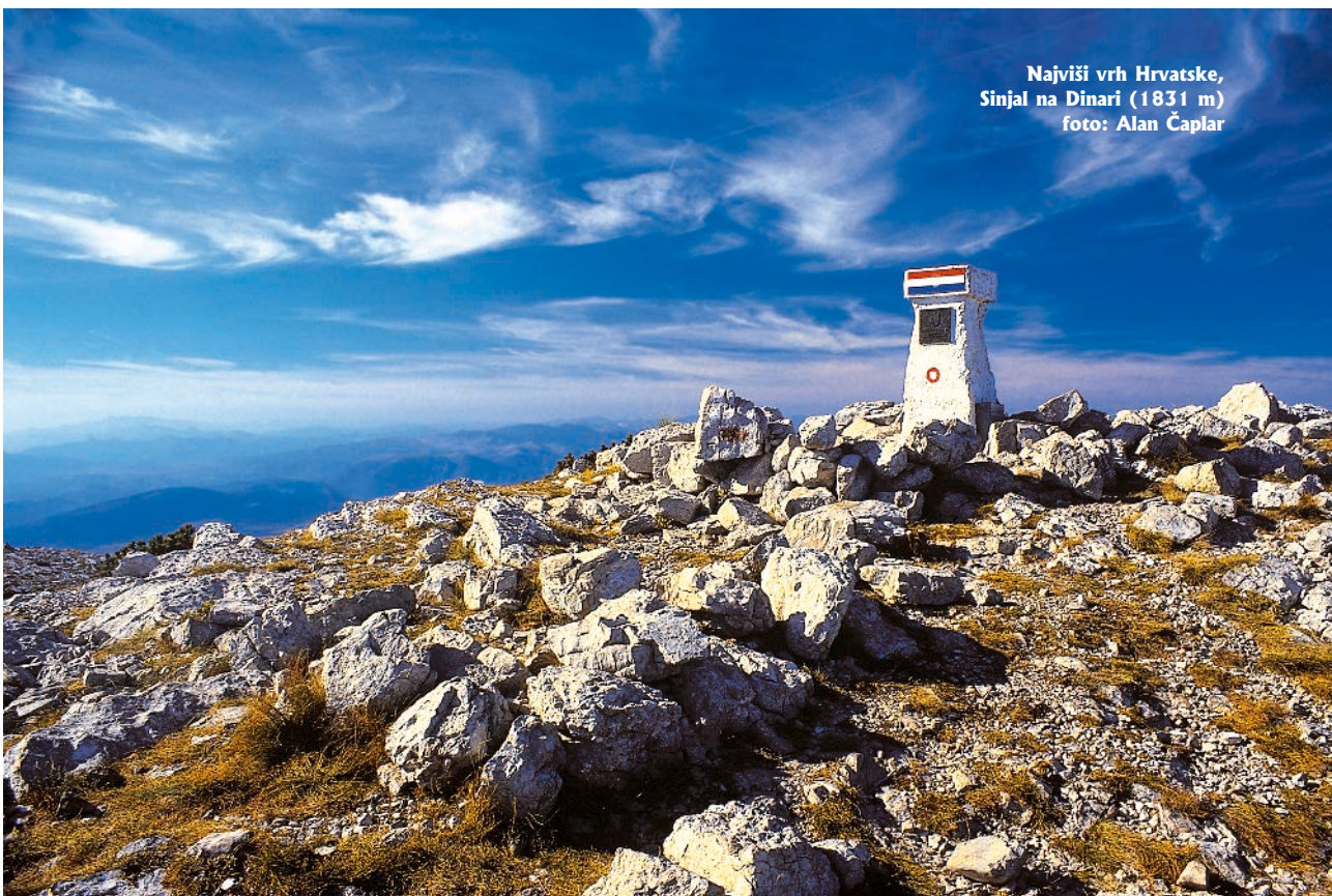
Najviši vrh Hrvatske, Sinjal na Dinari (1831 m)

Posebno je zanimljivo razmotriti odnose posjećenosti unutar svakog područja, pa zato prošećimo sada po područjima, uz kratak komentar dobivenih rezultata!