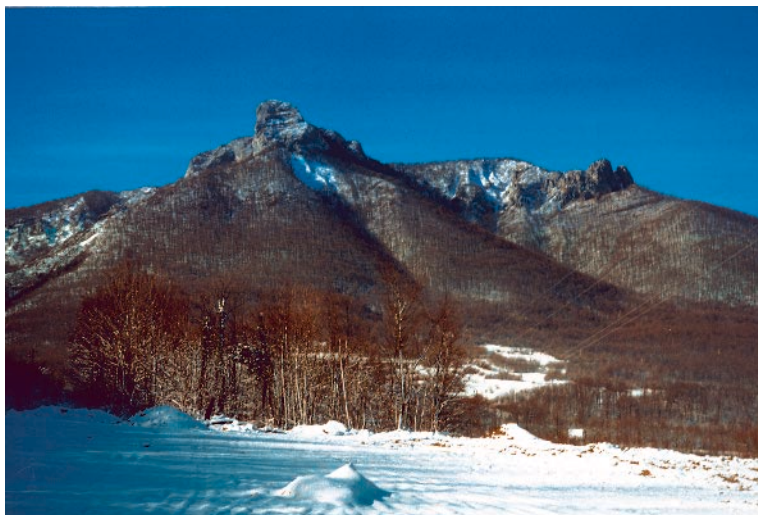
Klek - najpopularniji hrvatski vrh

5. Samoborsko gorje. Vrhovi Samoborskog gorja najposjećenije su točke HPO: među prvih deset vrhova čak su četiri od pet vrhova iz tog područja (Oštrc, Japetić, Plešivica i Okić).