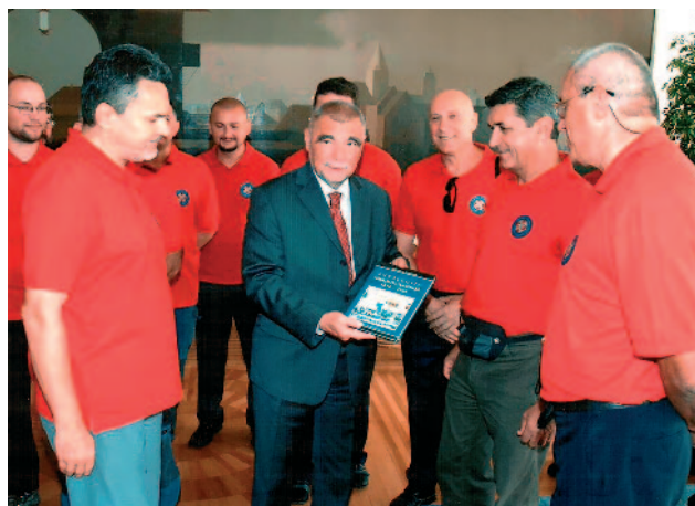
Antologija Hrvatskog planinara 1898 - 2008 u rukama predsjednika Mesića