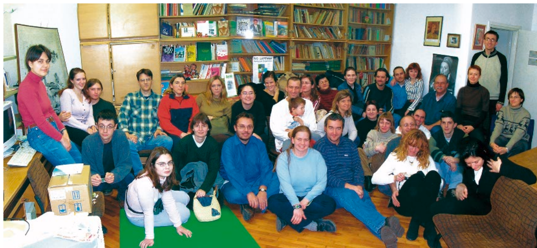
»Štvarni« sastanak forumaša u siječnju 2004.